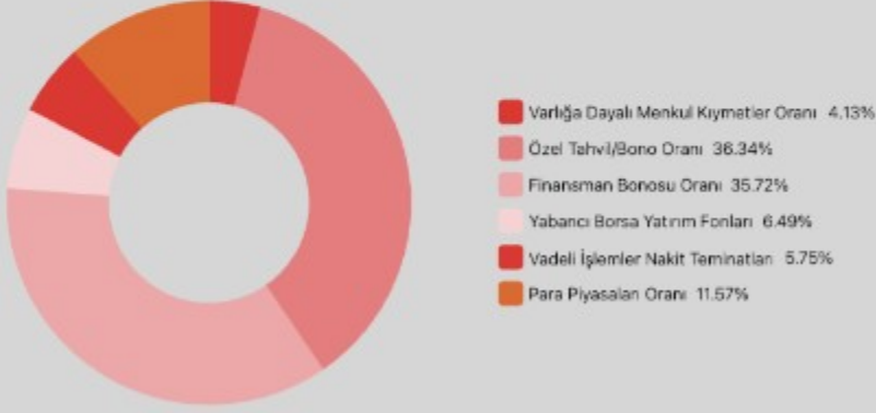
Güncel Fon Dağılım Oranı