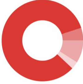
Güncel Fon Dağılım Oranı