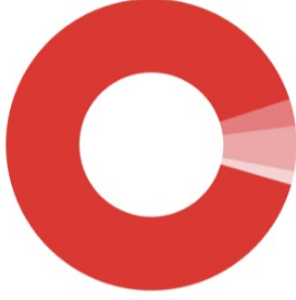
Güncel Fon Dağılım Oranı